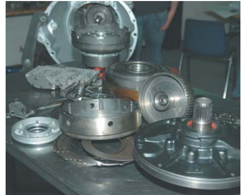
...Tot de werkbank er zo uitziet.